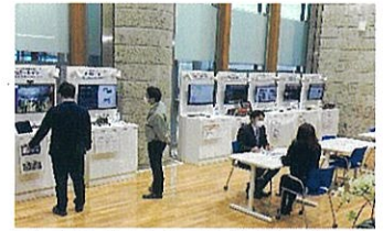
展示スペースでの体験・体感

✓ 展示スペースにおいて、業務の様々な場面で活用できる、AI等のデジタル技術を使った機器を実際に体験・体感することができます。