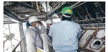
企業訪問・ヒアリングの様子

✓ 当センターで開催する相談会、ワークショップ、人材育成研修等に参加することで、AI等のデジタル技術についての理解と活用を促進できる人材を育成することができます。