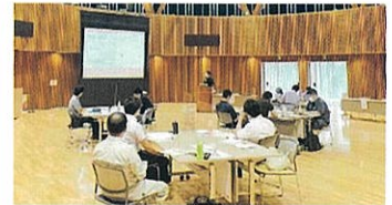
ワークショップの開催

✓ 当センターでは県内支援機関（栃木県産業振興センターなど）の紹介や補助金情報の提供など、AI等のデジタル技術導入に関して、幅広い支援を受けることができます。