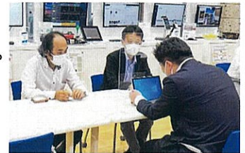
個別相談対応の様子

✓ AI等のデジタル技術が自社の業務にどのように適用できるのか？何が解決できるのか？等の疑問を個別に相談することができます。